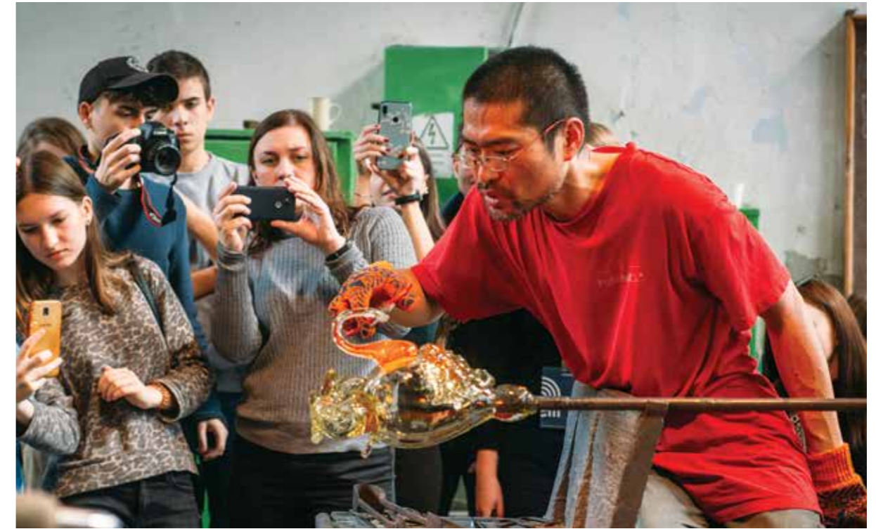
біля гутної печі Такеші Іто, Японія / Takeshi Ito, Japan at a glass furnace

найменшу роль або і зовсім відсутні. До реалізації твору з назвою "Роботи новачків" латиська мисткиня Анна Варнасе запросила молодих людей, які не мають відношення до скла і ніколи не тримали склову трубку. З незначною допомогою майстрів-гутників "склярі-аматори" власноруч виконали об'єкт, який згодом експонувався на виставці. Весь процес виконання було зафіксовано на відео, а відвідувачі експозиції повинні з допомогою попередньо встановленої на мобільному пристрої програми, переглянути ролик з виконання кожного об'єкта, наводячи камеру на виставлений поруч графічний код. З одного боку – робота автора композиції обмежена до ідеї та її організації, а не практичного виконання скляного об'єкта. З іншого – ілюстровано питання, яке породжує дискусії десятиліттями – роботи більшості художників у матеріалі виконують майстри-гутники, а не самі митці. Відірвані від концепції роботи, деформовані об'єкти з прозорого скла, які не наділені жодною естетичною, мистецькою чи іншою вартістю, окрім хіба емоційної прив'язаності самих виконавців, "склярів-новачків". Єдине переконливе нововведення, яке не піддається критиці – це такий популярний останнім часом інтерактив, до якого апелюють сучасні музеєзнавці та куратори арт-проектів. Наступна концептуальна композиція, проте вже наділена не тільки змістом, а й формою – робота японського митця, постійного учасника симпозіумів у Львові Казуші Накади "Символіка "L"". Серія гутних, наближених до реалістичних об'єктів – ра-