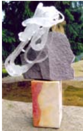
Ф. Черняк. "Сивина". Керамзит, скло, 50x25