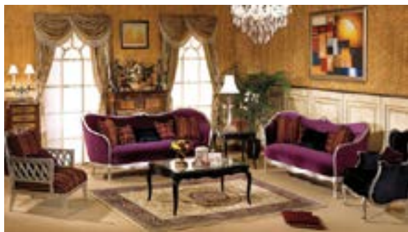
Принцип композиційного контрасту форм і кольору