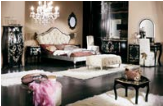
Принцип наявності обтікаючих форм