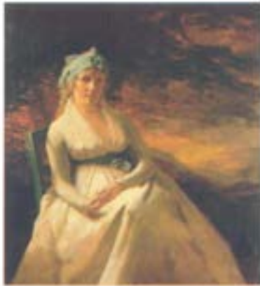
Генрі Реберн. Портрет місіс Ендрю. 1795 р., Художній музей "Джослін", м. Омаха, штат Небраска, США