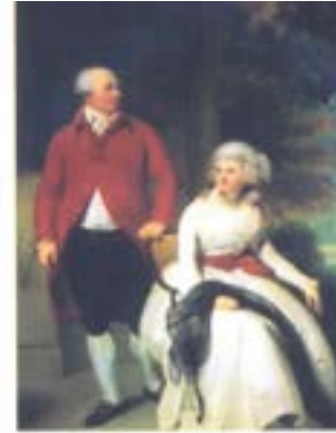
Томас Лоуренс. Портрет Джона Джуліуса. Ангерштейн з дружиною. 1790-1792 рр., Лувр, Париж