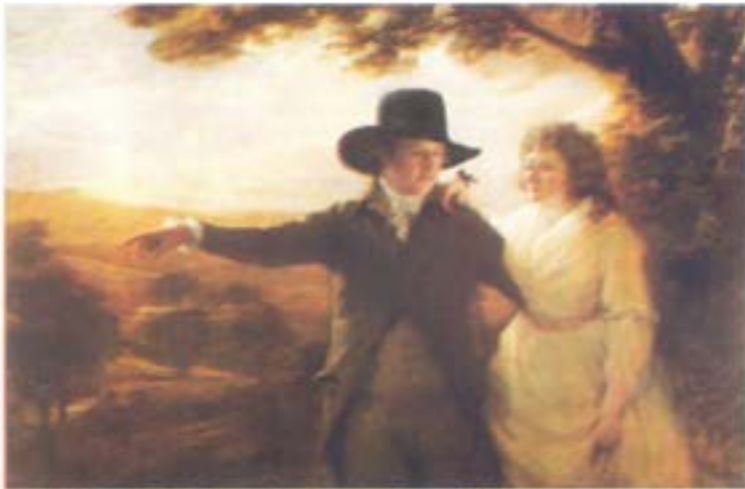
Генрі Реберн. Портрет сера Джона і леді Клерк. 1792 р., Приватне зібрання Альфреда Бейта, Великобританія