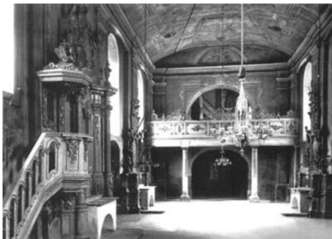
Інтер'єр костелу Св. Анни у Львові. Фото 1912 р.