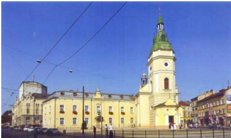
Храм Св. Анни у Львові. Сучасний вигляд