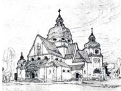
Проект перебудови костелу Св. Анни. Автор Людвік Соколовський. 1912 р.