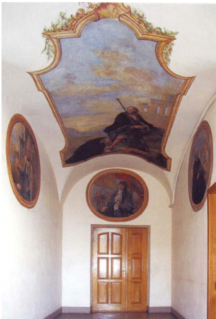
Передсінок монастиря з реставрованими фресками