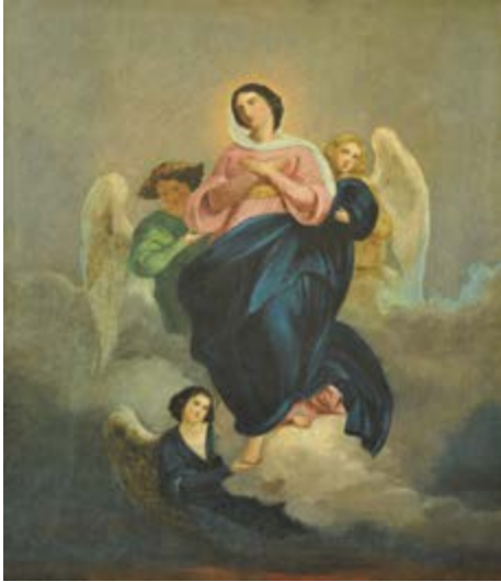
"Вознесіння Діви Марії"