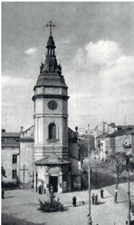
Храм Св. Анни у Львові. Фото 1912 р.