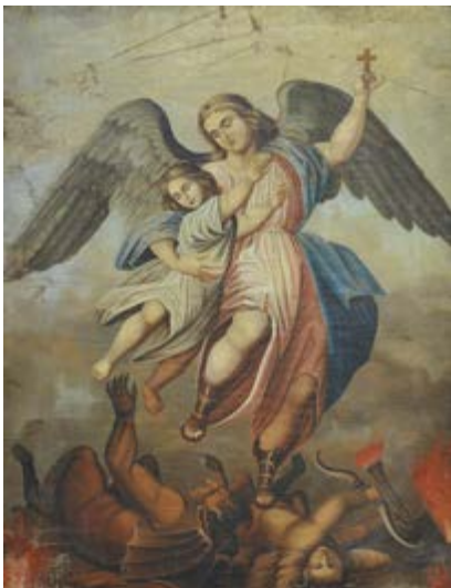
"Архангел Михаїл бореться із сатаною"