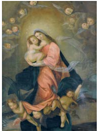
"Матір Божа з Немовлям у славі"